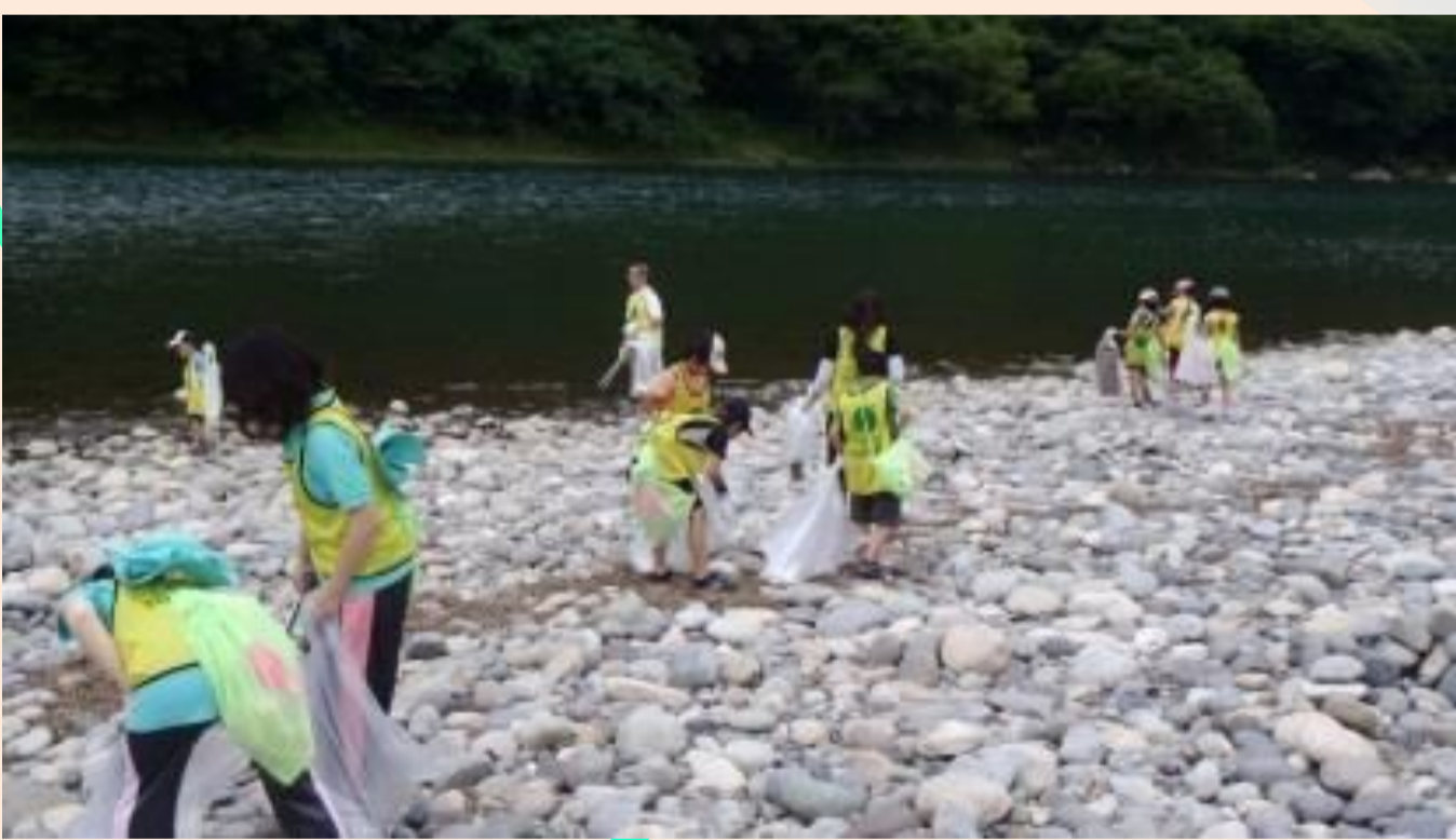
川を守る活動 Conservation Initiatives