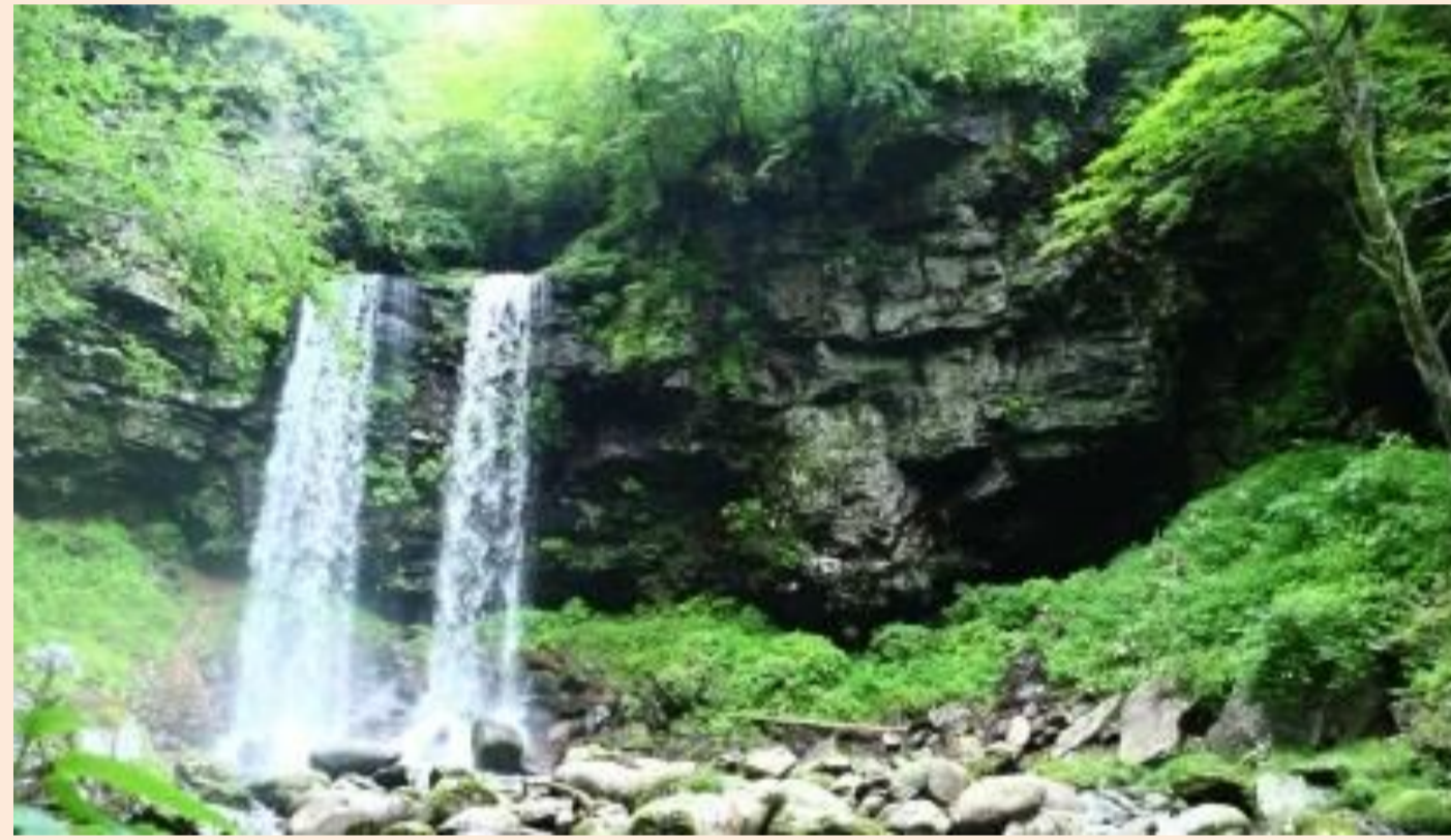
森が蓄える長良川の清流 Clear Waters